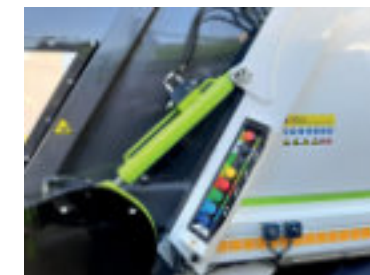
Monoscocca con tramoggia incorporata.